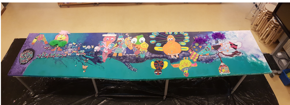
Kunstwerk 'Vogel op een tak', gemaakt door alle kinderen van De Bongerd.

Dromen, Denken en Doen zijn de pijlers van onze visie. Wij vinden de totale ontwikkeling van kinderen belangrijk. Deze ontwikkeling geven wij inhoud door cognitieve, sociale, emotionele en creatieve aspecten in samenhang aan te bieden. We leren bij ons op school met ons gevoel ( dromen ), met ons hoofd ( denken ) en met onze handen ( doen ). Zo gebruikt ieder kind zijn eigen kwaliteiten en ook elkaars kwaliteiten. Samen sta je sterker dan alleen. Naast taal, rekenen en lezen besteden we ook aandacht aan beeldende vorming, drama, dans, muziek, ICT en techniek. Creatief bezig zijn vinden we belangrijk. Op onze school wordt er bij wereldoriëntatie in alle groepen gewerkt met thema's waarbij de nieuwsgierigheid, eigen leervragen van kinderen en hun eigen inbreng belangrijk is. Kinderen leren in en buiten de school. In de hele school zijn werkjes van kinderen te zien, zodat iedereen kan zien waar we mee bezig zijn en we van het werk kunnen genieten.