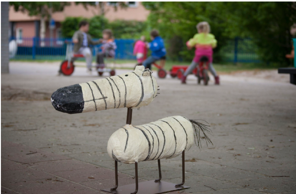
Dit is DrieDee, onze mascotte. Driedee staat voor Dromen, Denken, Doen: de 3 d's.

De rol van de leerkracht: 'Als je wilt dat gras groeit, dan moet je er niet aan trekken. Daar gaat het beslist niet harder van groeien. Wat wel helpt is de omstandigheden voor het gras verbeteren: veel licht geven, goed bemesten en voldoende water geven.' We kunnen stellen dat de visiekenmerken van De Bongerd nauw aansluiten bij het gedachtegoed van de meervoudige intelligentie. De visiekenmerken zijn geformuleerd vanuit de wereld van het kind en geven inhoud aan ons 'Dromen, Denken en Doen' .